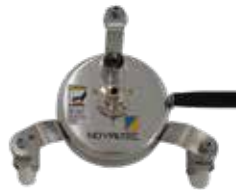
Twister ø 200/300