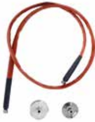
Tubo Eno-Steam + connexion Garolla et Din